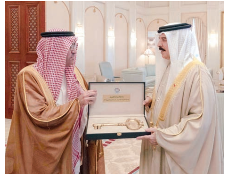
○ جلالة الملك يتسلم مفتاح السياحة العربية.

تسلم حضرة صاحب الجلالة الملك حمد بن عيسى آل خليفة عاهل البلاد المفدى مفتاح السياحة العربية لعام ٢٠٢٠، تقديراً وعرفاناً من المنظمة العربية للسياحة بجامعة الدول العربية لدوره وبعده تعزيز كل أوجه التعاون المشترك بين مملكة البحرين والمنظمة في قطاع السياحة وبمناسبة اختيار العاصمة للسياحة العربية لعام ٢٠٢٠. وأثنى جلالة الملك على استقباله رئيس المنظمة العربية للسياحة الدكتور بدر بن فهد آل فهد على الدور المهم الذي تضطلع به المنظمة وجوهرها في تطوير العمل العربي في مجال السياحة من خلال تحفيز الاستثمارات المشتركة وتسهيل الكوادر المتخصصة وتعزيز التبادل السياحي بين الدول العربية. كما أشاد جلالة الملك بالتعاون المثمر بين وزارة الصناعة والتجارة والسياحة وهيئة البحرين للسياحة والمعارض والمنظمة العربية للسياحة في إقامة المشاريع