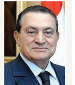
○ الرئيس الراحل حسني مبارك.

تنكيس الأعلام في البحرين اليوم حدادا نعى الديوان الملكي الرئيس المصري الأسبق محمد حسني مبارك رحمه الله الذي وافته المنية أمس. وأصدر الديوان الملكي بياناً جاء فيه: إن الأمة العربية فقدت قائداً بارزاً كرس حياته لخدمته ووطنه وأمة العربية وبعده شائهاً عبر عرولف مشهود من أجل تحقيق التضامن العربي وروح حيادية إنتمية جمهورية مصر العربية الشقيقة والديان عن قضائها بكل صدق وأمانة وإخلاص، وتكثرت ترهته ملافة وطيدة وخاصة مع صاحب السمو الشيخ عيسى بن سلمان آل خليفة رحمه الله