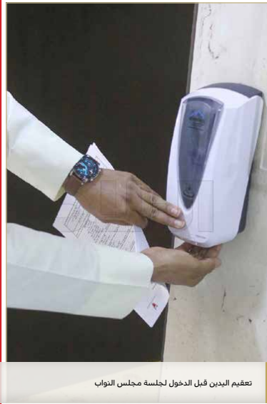
تفحص البدين قبل الدخول لجلسة مجلس النواب

ارتفاع الأسعار لا يتناسب مع الوضع المعيشي