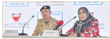
حاضر من المؤتمر

التناقص سلبية ولم يتم اكتشاف أي إصابات حتى اليوم بين الطلبة. وعن الإجراءات في المنافذ أوضح رئيس الأمن العام طارق الحسن أنه تم مراجعة الإجراءات على المنفذ البري، ونحن بصدد تطبيق خطة احترازية للفحص على المنافذ البحرية.