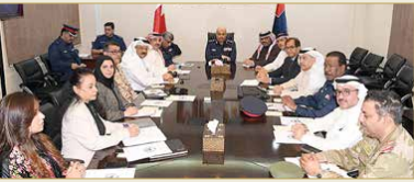
الرفيق طارق الحسن يبرأس اجتماعاً طارداً للجنة الوطنية لمواجهة الكوارث

الفيروس. وأوضح أن اللجنة، تعمل على دعم وتوفير كافة المتطلبات اللازمة لتنفيذ خطة الفريق الوطني، من أجل حماية المواطنين والمقيمين، حيث إن اللجنة في حالة