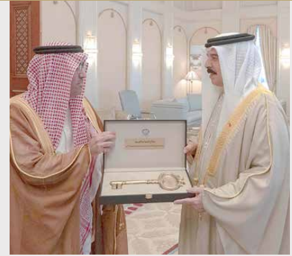
جلالة الملك ينسلم مفتاح السياحة العربية للعام 2020

أشاد عاهل البلاد صاحب الجلالة الملك حمد بن عيسى آل خليفة، لدى استقبال جلته أمس رئيس المنظمة العربية للسياحة بجامعة الدول العربية بندر آل فهد، بمستوى التعاون المتميز بين وزارة الصناعة والتجارة والسياحة، وهيئة البحرين للسياحة والمعارض، والمنظمة العربية للسياحة في تنظيم البرامج السياحية لزيارة المعالم التاريخية والحضارية والثقافية التي تزخر بها البحرين وأهلتها لأن تكون وجهة مهمة بخريطة السياحة العالمية. (02)