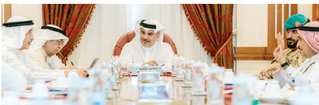
○ سمو ولي العهد يترأس اللجنة التنسيقية.

والخاصة للأشخاص ذوي الإعاقة مدة أسبوعين. وطالبوا بضرورة تحمل المسؤولية الوطنية من قبل المواطنين وأصحاب المحلات والحفاظ على صحتهم وتحصين أنفسهم والأخرين بعدم الذهاب إلى تلك المناطق الموبوءة، وعدم أخذ الأمر بعناد. وقد أحال النواب إلى الحكومة مجموعة من الاقتراحات برغبة بصلة استجواب بشأن فيروس كورونا.