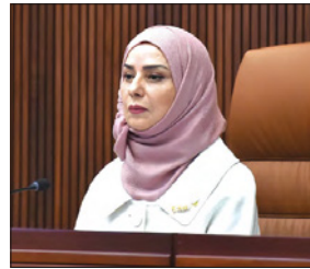
رئيسة مجلس النواب