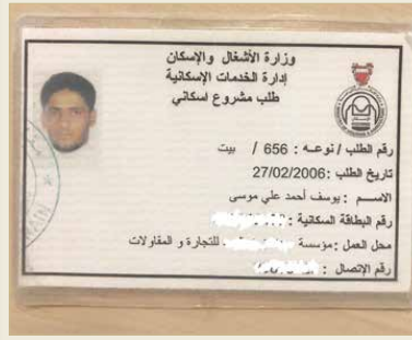
بطاقة الطلب الإسكاني

ما زال يعيل والدته المقيمة في المنطقة بعد وفاة والده وينتظر بيت العمر