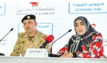
○ مؤتمر صحفي للفريق الوطني للتصدي لكورونا.