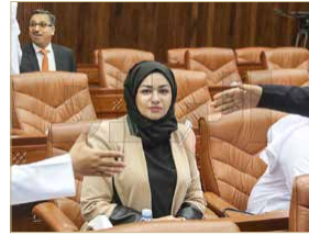
كلمت الحايكي بين مصالحة وشبحة

الوزير قرر عقوبة "مزاجية" لم تترد بالقانون