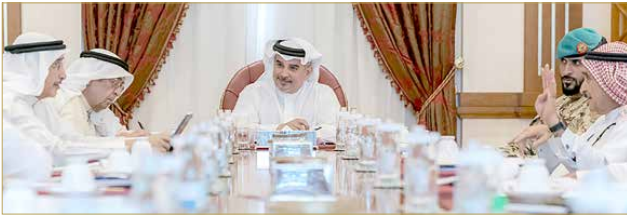
سمو ولي العهد يترأس اجتماع اللجنة التنسيقية بحضور عدد من كبار المسؤولين

سمو ولي العهد: صحة المواطنين والمقيمين أولوية